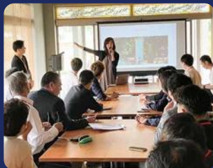
▲ 昨年度のフジエダ未来共創会議の様子

地域課題の解決策や、斬新な事業構想、開発・研究シー ズなど、様々なビジネスアイデアの芽を育める絶好の チャンス! 地域一体となって、地域課題の解決につな がる先進的なプランの実現をサポートします!