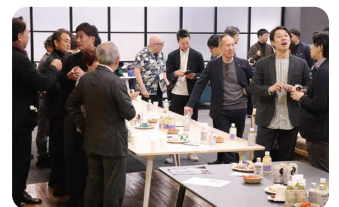
▲ 昨年度ビジネスプランコンテストの様子