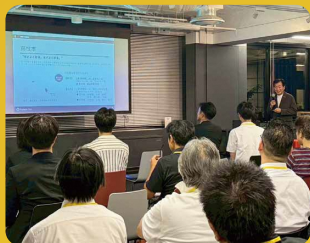
▲ 昨年度のフジエダ未来共創会議の様子

地域課題の解決策や、斬新な事業構想、開発・研究シー ズなど、様々なビジネスアイデアの芽を育める絶好の チャンス！地域一体となって、地域課題の解決につな がる先進的なプランの実現をサポートします！