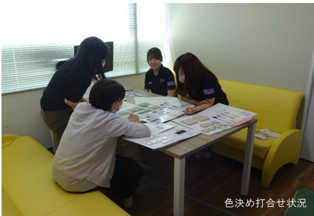
色決め打合せ状況

周囲の建物（観覧席やダッグアウト）や景観（環境との調和）を配慮した配色で決定しました。