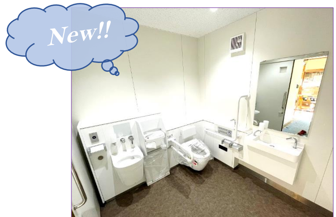
バリアフリートイレ