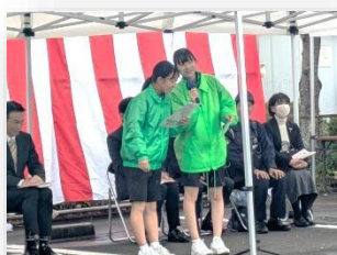
大洲中学生ボランティア挨拶

11月9日（日）、朝から小雨のぱらつく天気でしたが約2,300人の方々が訪れ盛大に実施することができました。ステージ発表は縮小して行いましたが、雨の中でも元気よく素晴らしい発表をした皆様、またふれあい広場での模擬店をはじめとして、開催にご協力いただきました皆様、ありがとうございました。