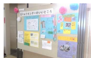
大洲小学校2年生展示