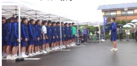
大洲中学校2年生合唱