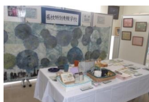
藤枝特別支援学校展示