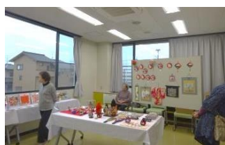
自主グループ 手芸の和