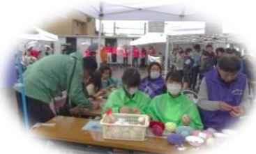
さわやかクラブ体験