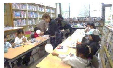
バルーンアート体験