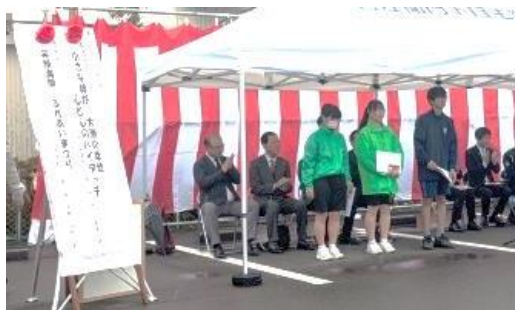
スローガン表彰者