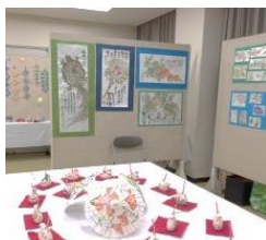
自主グループ 花ごよみ