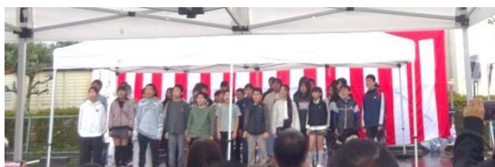
大洲小学校6年生合唱