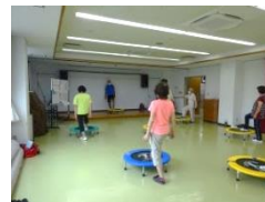
トランポウォーク