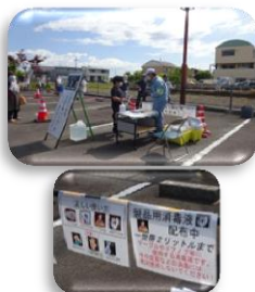
5/7 大洲地区交流センターでの配布の様子

（家庭内の手すりやドアノブなどの身の回りの消毒用として使用してください） 346の方が利用しました