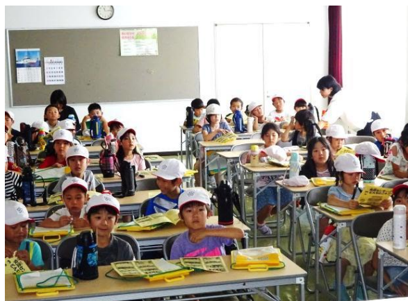
集会室で交流センターの概要を聞く大洲小児童

大洲小学校2年生83人(引率教諭4人)が、町のことについて調べよう一学区の探検一という生活科の授業でこのほど当交流センターを訪れました。三つの班に分かれ施設の概要や役割について説明を受けた後、学習室や料理実習室など各部屋を探検しました。また、玄関スロープや駐車場等の障害者に配慮した館内外の施設設備も見学しました。そして、交流センターでどんな人が働き、地域とどんな関わりがあるかを調べました。一生懸命ノートをとる子や質問をする子も大勢いて、みな真剣な表情で校外授業を受けて学校へ戻って行きました。