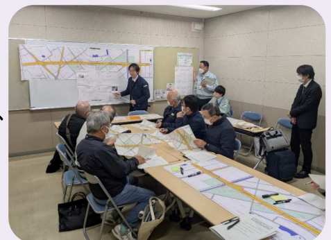
事業進捗説明会の様子

今年度の「志太中通信」は、今回で最後になります。令和8年度も引き続きよろしくお願いいたします。