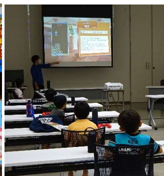
「小学生 e スポーツ体験会」