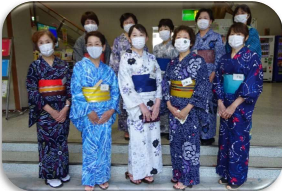
一人で浴衣の着付けが出来るようになりました!!