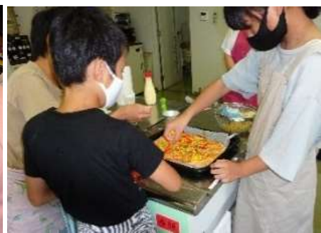
「親子で楽しいパン作り教室」