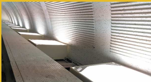
水銀ランプ（更新前）