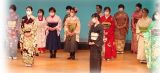
藤枝市民文化祭 芸術・音楽発表会