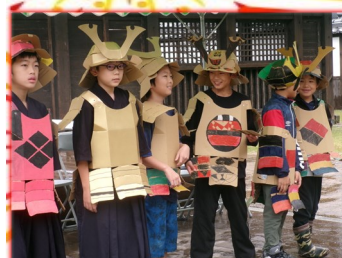
手づくりのダンボール 甲冑を着た小学生

11月9日(日)に『東海道岡部宿にぎわいまつり』が、大旅籠 柏屋～市民ホールおかべまでの旧東海道で開催されました。当日はあいにくの雨模様でしたが多くの来館者が傘を差しながら岡部宿の魅力を楽しんでいただきました。また市民ホールおかべは前日から「かるちゃあ・ぱーく」と題して利用団体等による作品展示など、多くの来場者でにぎわいました。