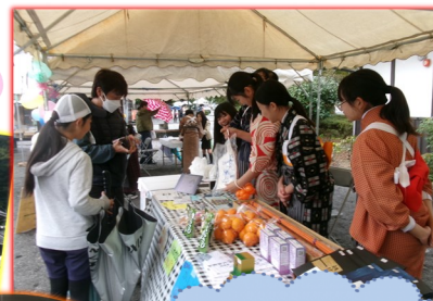
大活躍！着物姿で 手作りを販売する 岡中のボランティア