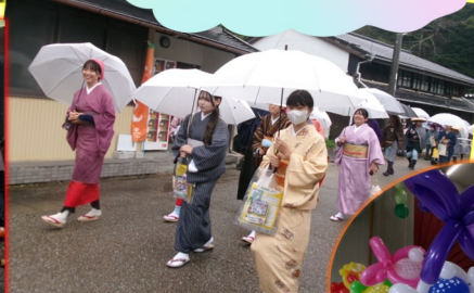
おさかなの バルーンが 可愛い!!