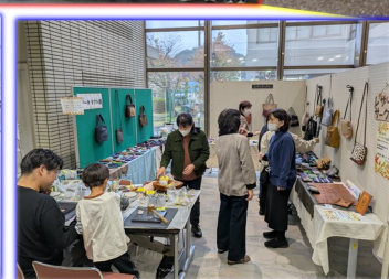
「かるちゃあ・ぱーく」のワークショップ にぎやかな雰囲気の中、参加者は思い思いの作品づくりを楽しみました！