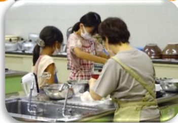
リトルパティシエ、おいしくできました