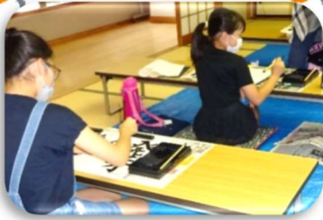
集中した筆づかい、うまく書けました