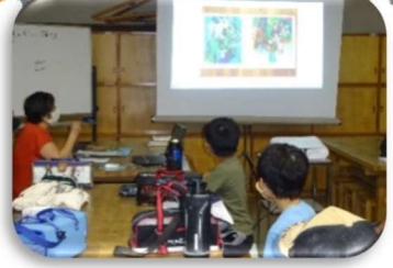
遠近の技でいきいき描けました