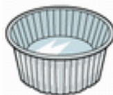
カップ(プラ、アルミ)