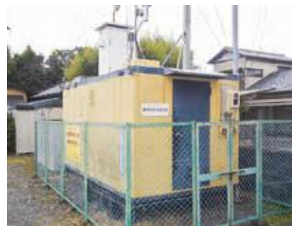
環境大気測定局(藤枝市高柳)

また、紫外線が強く、気温が高い期間は、光化学オキシダントが発生しやすいするため、光化学オキシダントの監視の強化を図り、注意報などが発令された場合には市民の皆様と同報無線などでお知らせします。令和5年度の監視強化期間は、5月1日から9月30日の間で、当該地域(志太・川根地区)では、注意報の発令はありませんでした。