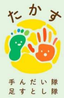
手んだい隊 足すとし隊