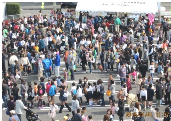
昨年のふれあいまつりふれあい広場の様子

計画では、11月6日(日)に高洲地区交流センターで地域をあげて開催することとしました。一部の内容では、屋外では、たいやき、いか焼き、やきとり、フランクフルト、野菜やくだもの農産物のほか各種の模擬店が出店します。また、毎年人気の刃物研ぎ、血圧・腹囲測定健康増進コーナーもあります。屋内では、園児・小中学生の遊戯、ダンス、合唱、演奏のほか、一般成人の踊り、パネルシアター、演奏、合唱等の各種演技発表等があります。老人会や円月荘の作品展示も行われ、更正保護施設の製品販売、そしておおぜいのみなさんが行列を作るチャリティーバザーも催されます。(詳しくは、10月20日発行の高洲地区交流センターだより特集号をご覧ください)