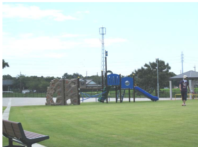
完成した栃山川中の橋公園

場所は、栃山川に架かる「中の橋」(田沼街道の土瑞橋から一つ下流にある橋です)の手前に位置し、第五自治会の大新島町内に隣接する河川沿いです。