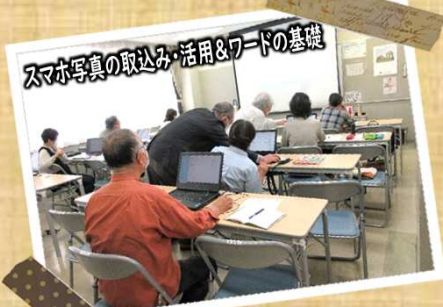
スマホ写真の取込み・活用&ワードの基礎