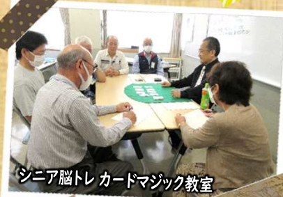
シニア脳トレ カードマジック教室