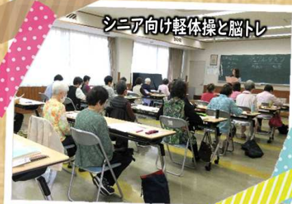
シニア向け軽体操と脳トレ