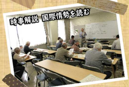
時事解説 国際情勢を読む