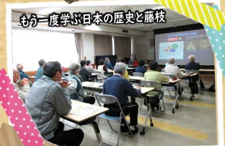
もう一度学ぶ日本の歴史と篠枝