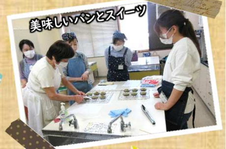
美味しいパンとスイーツ