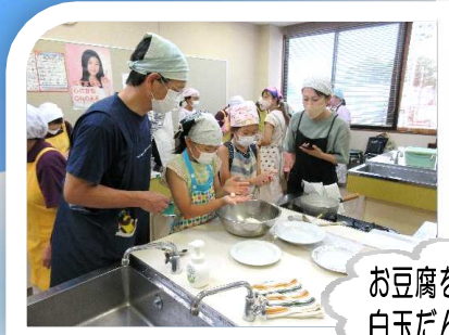
お豆腐を使った白玉だんご