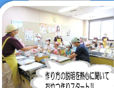
作り方の説明を熱心に聞いておやつ作りスタート!!

8月6日(土)に『夏の冷たいおやつ作り』講座が開講し、6種類のおやつが美味しくできました。