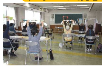
シニア向け軽体操と脳トレ講座