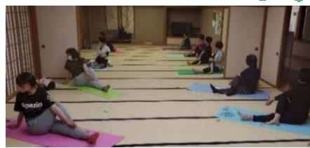
はつらつヨガ 初心者コース

今年度の交流センター講座(12講座)が5月6日の「はつらつヨガ 初心者コース」を皮切りに、次々と開講しています。子どもから高齢者まで、さまざまな講座にチャレンジしていきます。