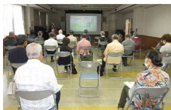
歴史を100倍楽しむための講座