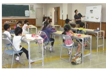
いきものおもしろあそび