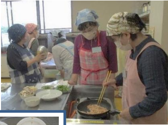
【ヘルシー楽しいクッキング】