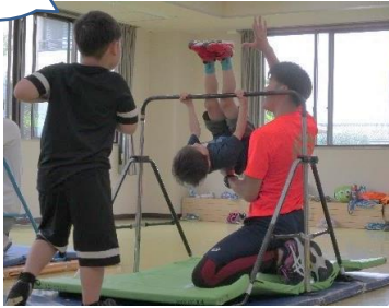
【小学生の体操教室】