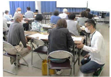
【スマホを上手に活用 初心者編】