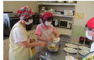
ライスサラダ・茄子の田楽ほか