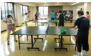
基本練習(フォア打ち)