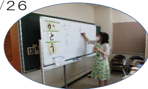
「ありがとう」を練習しました