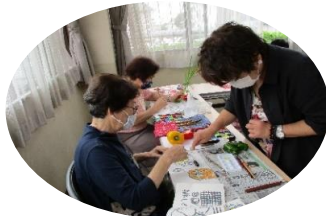
先生のワンポイント アドバイスでより素敵に！