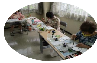
色々な夏野菜を 自由にのびのびと