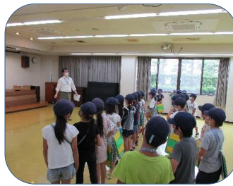
図書室など気軽に利用しに来てくださいね