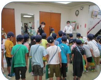
たくさんの質問を してくれました