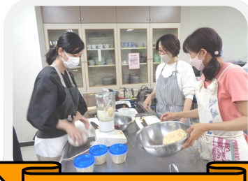
瀬戸谷まるごと クッキング