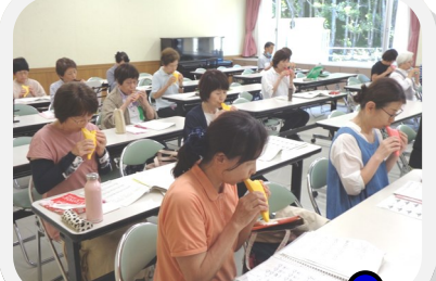
たのしいオカリナ