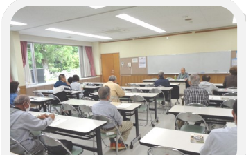
瀬戸谷・滝沢の おもしろ郷土史