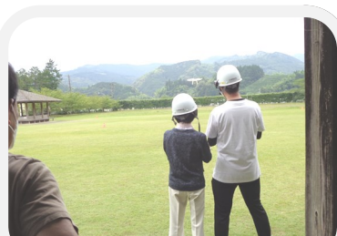
ドローン入門体験