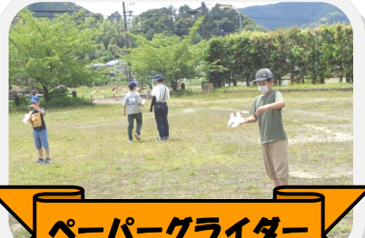
ペーパーグライダー を作ろう