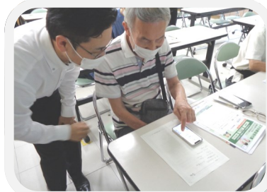
シニア・スマホセミナー