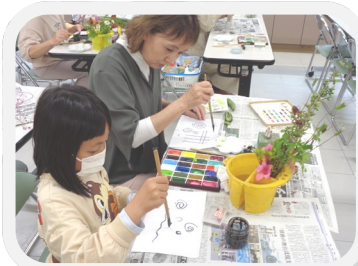
四季を楽しむ絵手紙

5月13日の「四季を楽しむ絵手紙」を皮切りに令和5年度の瀬戸谷地区交流センター講座が続々講じています。受講生の皆さん楽しんでください。