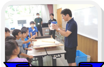
わくわく理科 体験教室