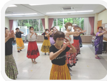
エンジョイフラダンス