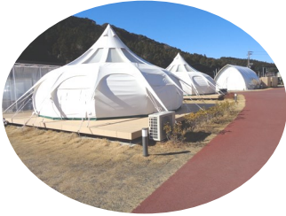
校庭に並んだ様々なテント