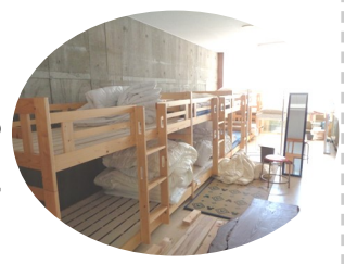
2段ベッドの宿泊室