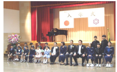
瀬戸谷小・中学校合同入学式