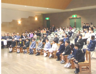
瀬戸谷小・中学校合同入学式