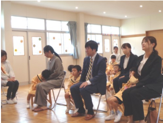
せとやこども園入園

桜が満開に咲き誇る4月7日（火）に せとやこども園 の入園式、4月8日（水）には瀬戸谷小・中学校の合同入学式が藤の瀬会館で行われました。かわいらしい入園児、瀬戸谷小・中学校の1年生たちも緊張した面持ちで希望に胸を膨らませ、入園式・入学式に臨みました。入園式では先生方による人形劇でなごやかに、入学式ではご家族や来賓が見守るなか小・中学校の新1年生同士が手を取りあい入場し、先生方の励ましの言葉を受けました。同級生や上級生、地域の皆さんと協力して色々なことにチャレンジしてください。