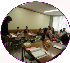
とても楽しかったよ～

まずはアルファベット。それから、新しいお友だちといっしょにあいさつの仕方を学びました。