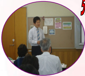
家康ゆかりの地や史跡を訪ねるにあたり、郷土の地侍や家康壮年期の攻城戦について学習しました。