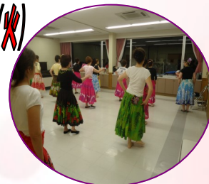
ステップ難しいけど、楽しかったです。