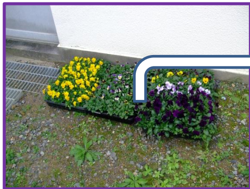
次に中庭の花壇に ビオラを植えます。