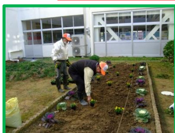
葉牡丹の周りにビオラが植えられました。中庭の花壇が一層華やかになりました。花となかよし隊の皆さん、本当にいつもありがとうございます。