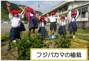
フジバカマの植栽