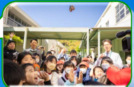
朝比奈で誕生したアサギマダラの放蝶