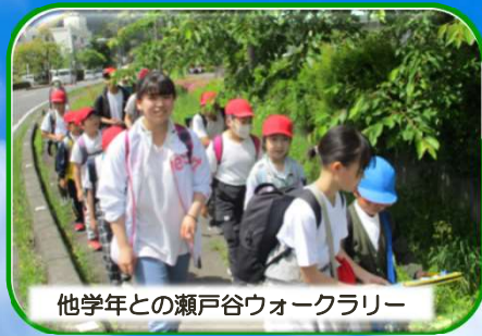
他学年との瀬戸谷ウォークラリー