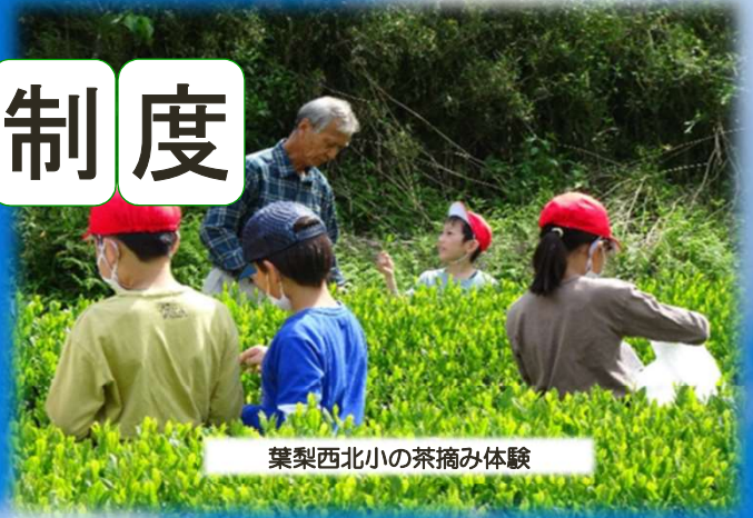
葉梨西北小の茶摘み体験

小規模特認校制度とは、 中山間地における特色ある教育活動を展開する学校（葉梨西北小・瀬戸谷小・朝比奈第一小） へ入学・転学ができる制度です。