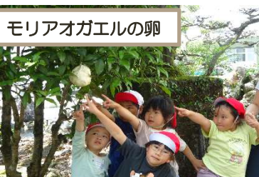
モリアオガエルの卵