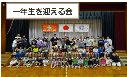
一年生を迎える会