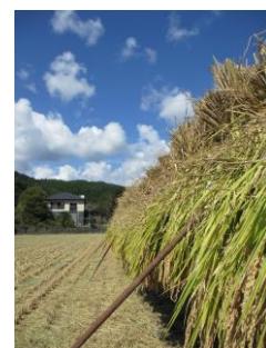
刈り取られた稲 →70kgのお米に