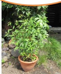
T邸(村良)のフジバカマ