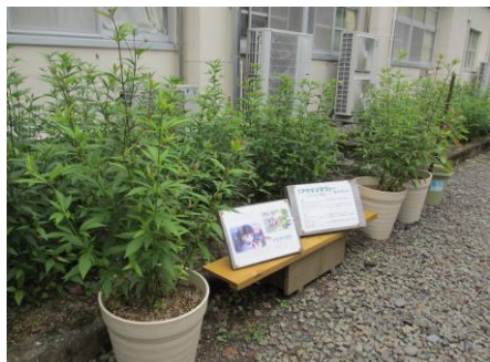
朝一小のフジバカマ