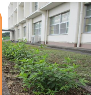
Y邸(子持坂)のフジバカマ