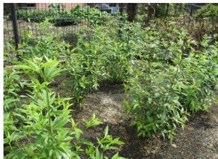
いきいき交流センターのフジバカマ