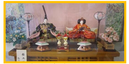
地域から寄贈された雛人形

2月26日（木）へと延期させていただいた11回目のアルミ缶回収へのご協力ありがとうございました。 今回をもちまして、今年度の回収は最後 になります。皆様のご協力のおかげで、 40,000円を超える収益 となりました。生徒の学校生活に役立つものの購入等の資金とさせていただきます。ご協力ありがとうございました。