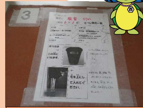
清掃用具の整頓の仕方