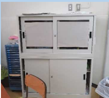
黑板横の棚の目隠し