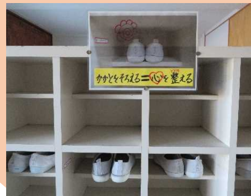
靴のキレイな棚への入れ方