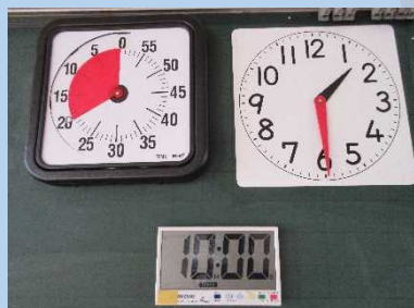
見通しをもって活動するための タイマーや時計