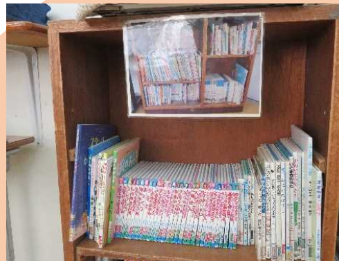
本棚の整理整頓の仕方