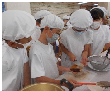
黒はんぺんづくり

「1・2」「ソーレ！」のかけ声でパドルを漕ぎました。チームワークのよさをほめられました。