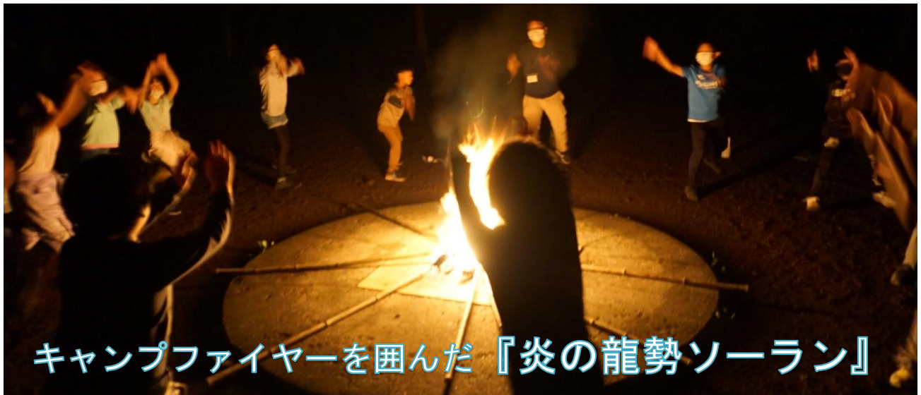
キャンプファイヤーを囲んだ『炎の龍勢ソーラン』

4・5年生が、朝霧野外活動センターで2日間の自然体験教室を行いました。台風11号の影響が心配された9月6日（火）、7日（水）でした。子供たちに思い切り自然を体験させたいという願いから、テントで寝る体験を取り入れています。そのため、風雨の影響で、夜間は施設に避難しなければならないかもしれない。びちょびちょになってしまうことがあるかもしれない。そんな心配もありました。しかし、様々な状況でも、対応できる、いろいろな体験を「笑顔」に結びつけていく「あさひなっ子」だと信じていました！（正直、ドキドキの方が大きかったです）子供たちは、期待以上の姿を見せました。