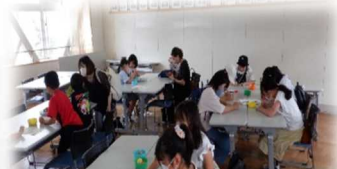
ペーパーワーク、塗り絵