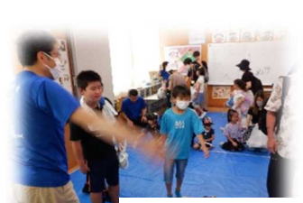
やらざあ~会「ミニゲーム」