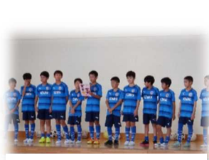
スポ少交流・体験