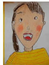
1年生が描いたペア6年生の顔