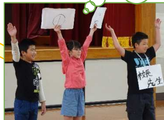
学校生活は楽しいよ紹介