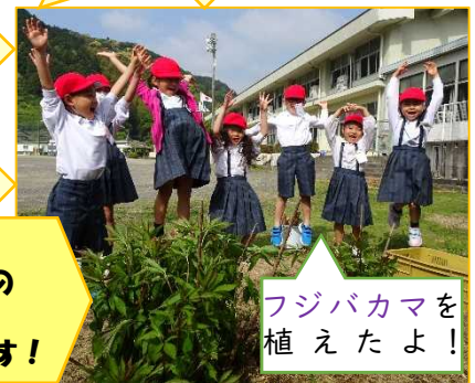
フジバカマを 植えたよ!