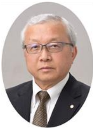
教育長 中村 禎