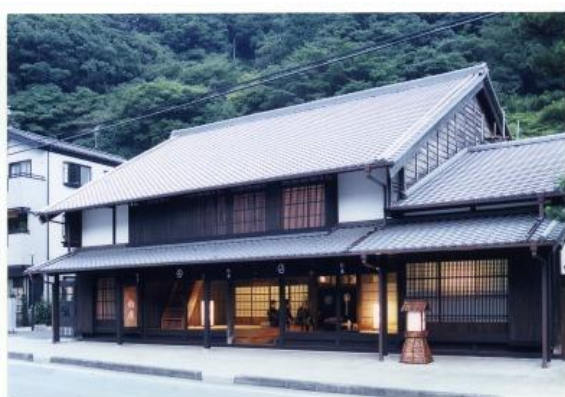
岡部宿大旅籠柏屋