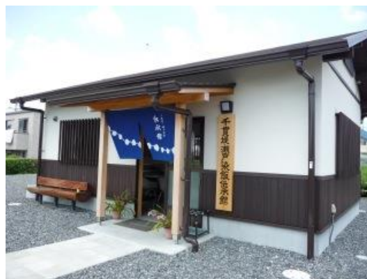
千貫堤・瀬戸染飯伝承館