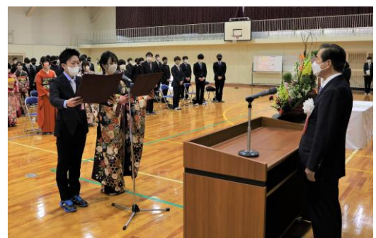
式典の様子(西益津会場)