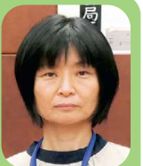
日本共産党 さとうまりこ 議員