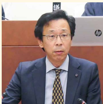
石井 通春 日本共産党 議員