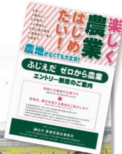
「ふじえだゼロから農業エントリー制度の認定者が耕作を開始しました。」