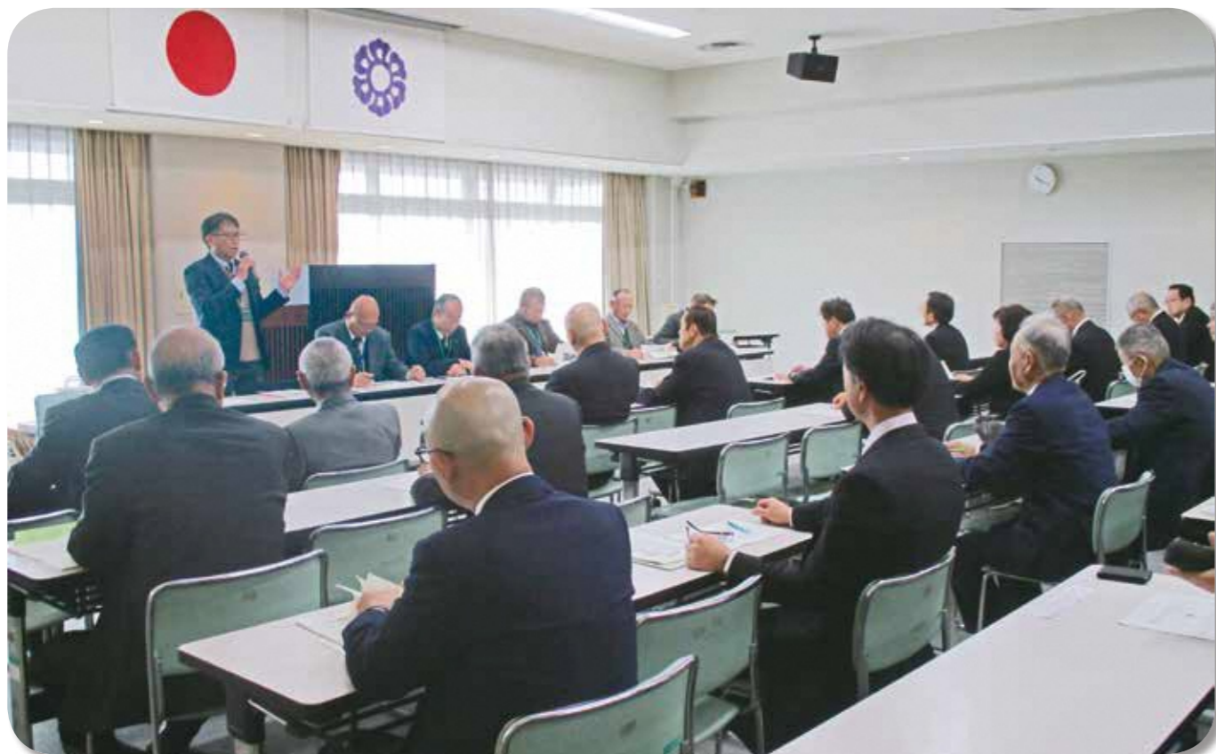
農地利用の最適化について講演する農業委員会 (藤枝市役所にて)

藤枝市の農地利用最適化推進の取組を視察に、三重県津市農業委員会が藤枝市役所を訪れました。視察研修では、東部（広幡・西益津・藤枝）地区の農業委員が東部地区農地利用最適化推進協議会の取組を紹介し、津市農業委員会のみなさんは熱心に聞き入っていました。