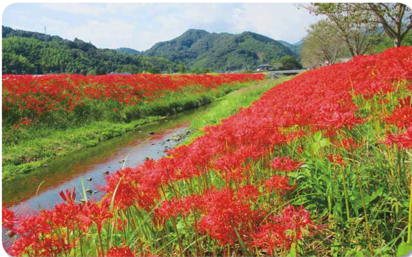
見ごろを迎えた彼岸花（西方）