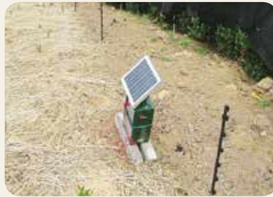
▲電気柵設置の事例

藤枝市では、これらの対策を行う農家等に対して助成を行っています。例えば、 一つの地区においてイノシシ対策用の金網柵を設置したい場合、耕作者が3戸以上 ある等の国の補助要件を満たせば、金網柵の支給を行っています（設置作業は地元 農家の方になります）。また、金網柵周辺の放任果樹の伐採や草木の刈り払いなど の緩衝帯整備も併せて助成を行っています。その他、個々の農家へ電気柵設置に対 する補助金（購入前に申請が必要）や、地域ぐるみで対策を実践していきたい地区 へ、被害対策の研修会を開催するなどの事業を行っていますので詳細は、市役所農 林課にお問い合わせください。（TEL：054-643-3550）