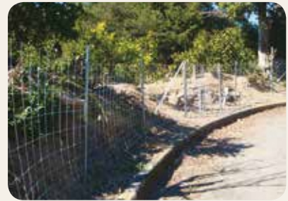
▲金網柵設置の事例