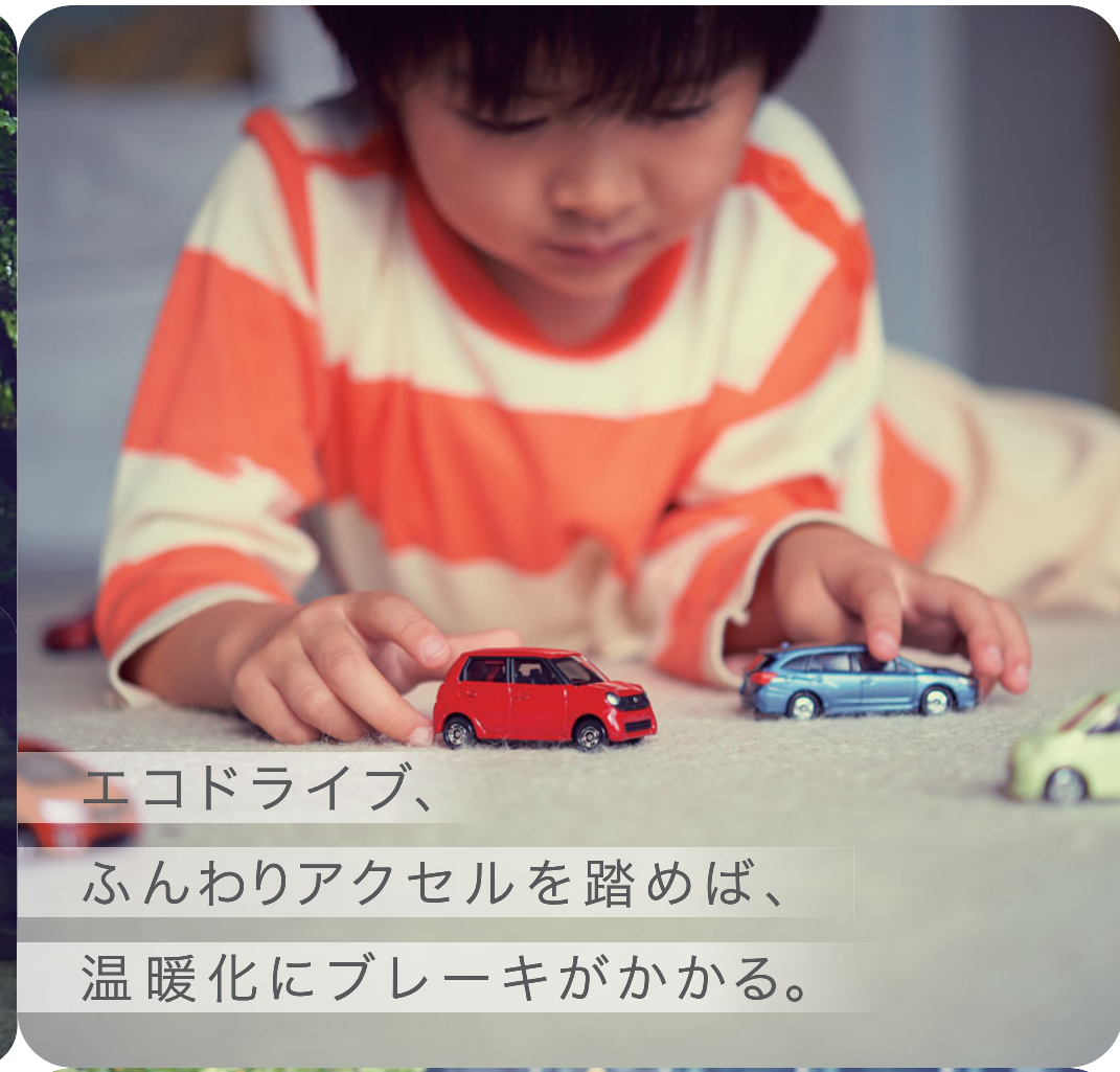
エコドライブ、ふんわりアクセルを踏めば、温暖化にブレーキがかかる。