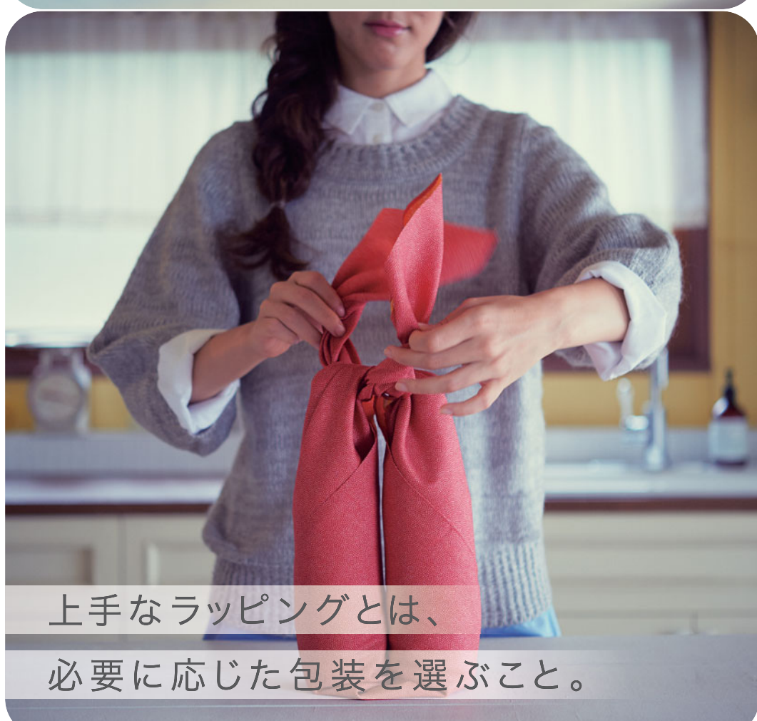
上手なラッピングとは、必要に応じた包装を選ぶこと。