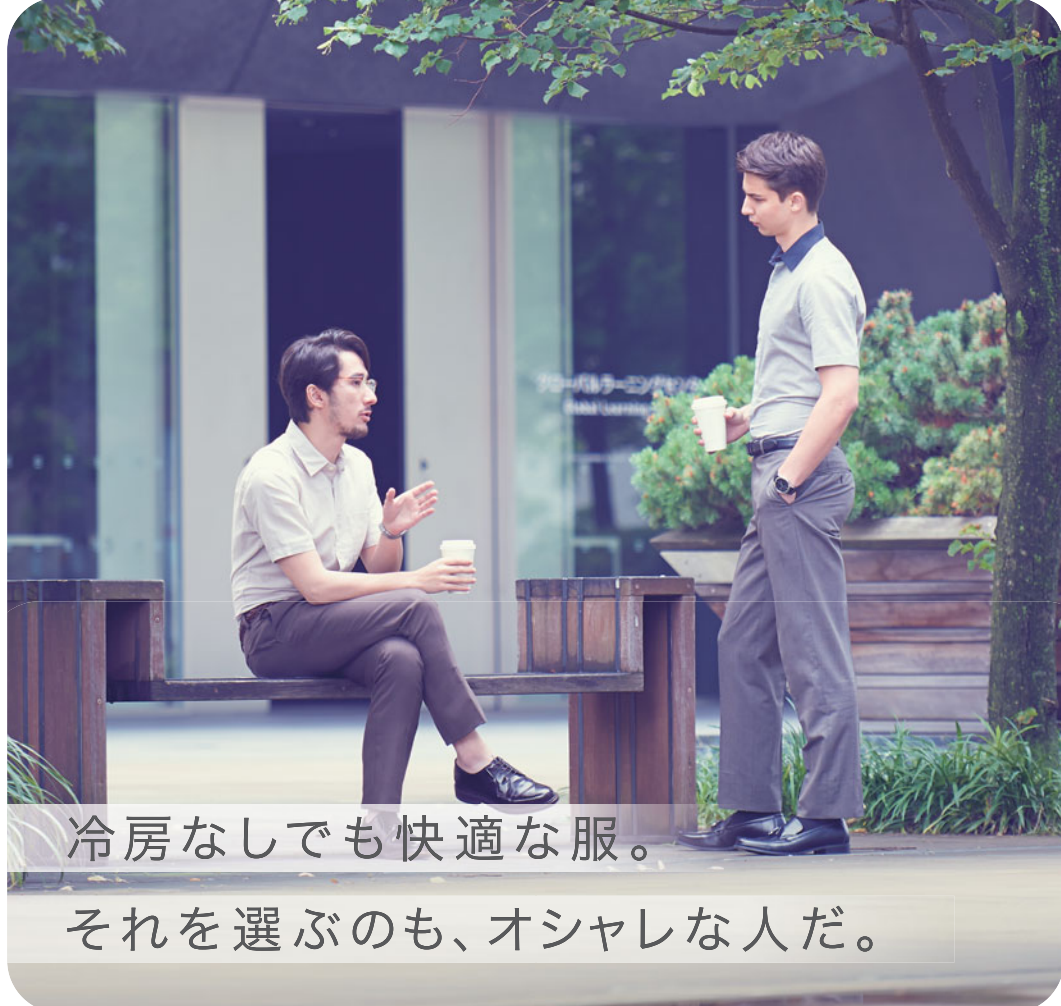
冷房なしでも快適な服。それを選ぶのも、オシャレな人だ。