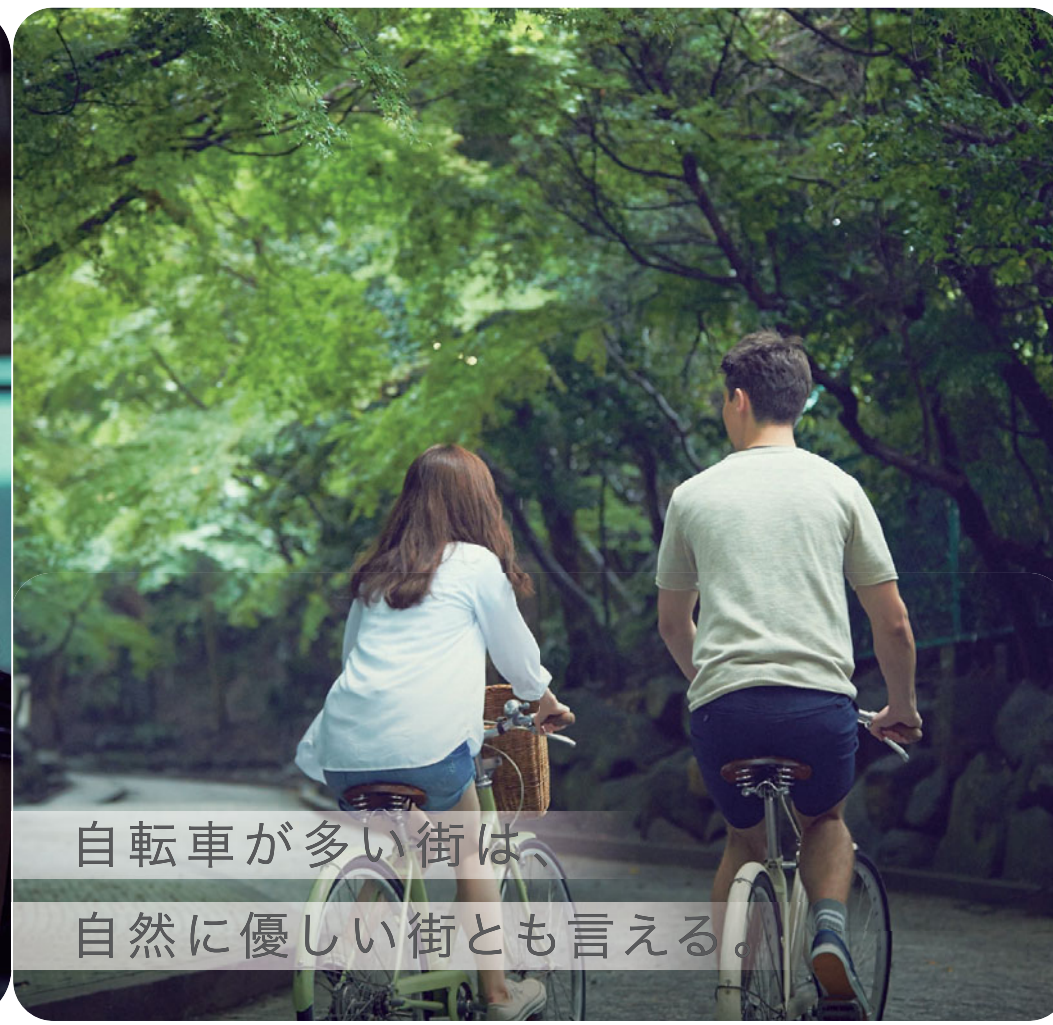
自転車が多い街は、自然に優しい街とも言える。