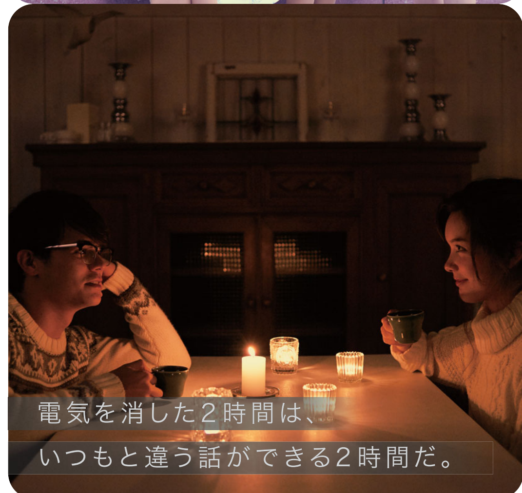
電気を消した2時間は、いつもと違う話ができる2時間だ。