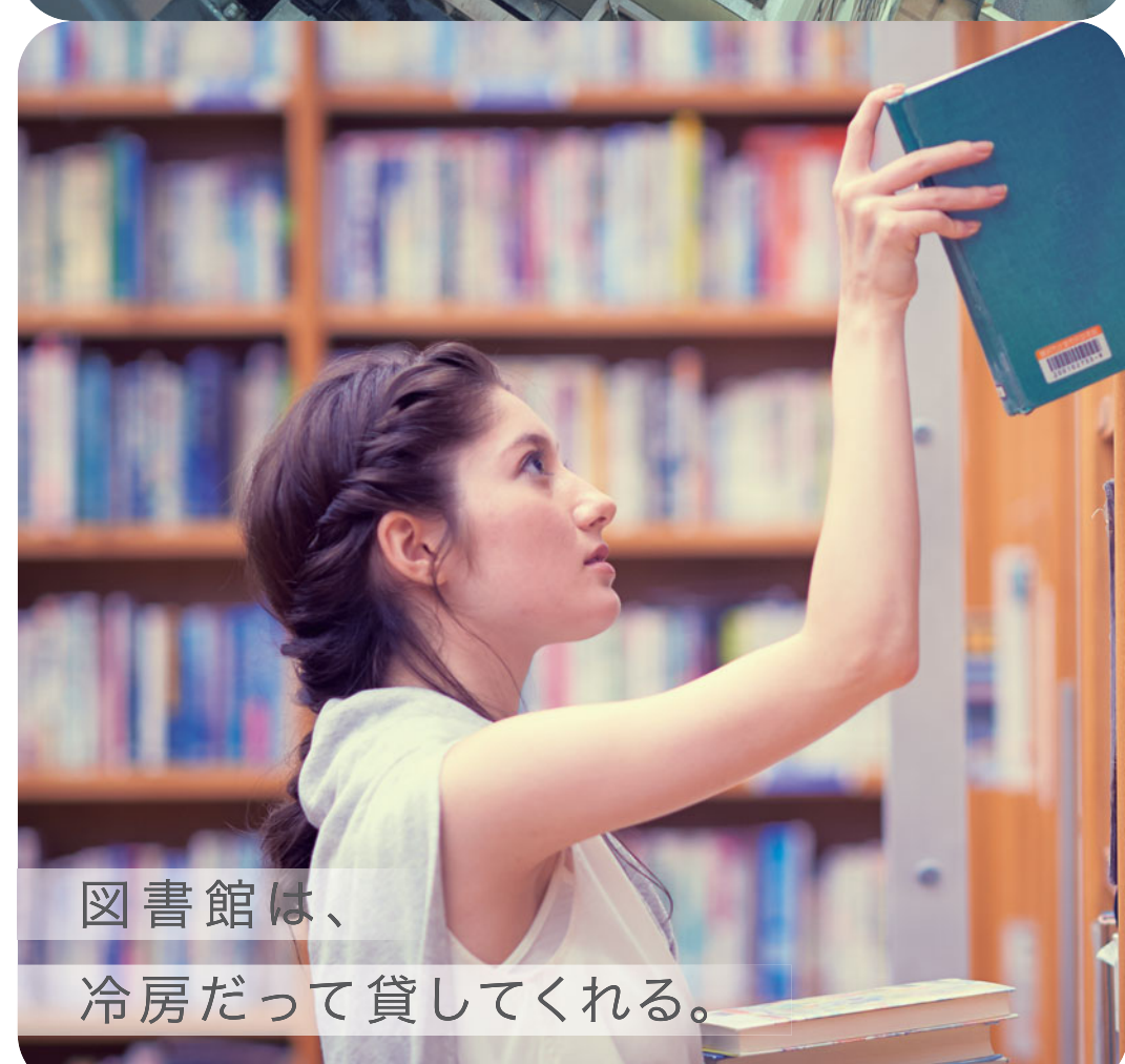
図書館は、冷房だって貸してくれる。