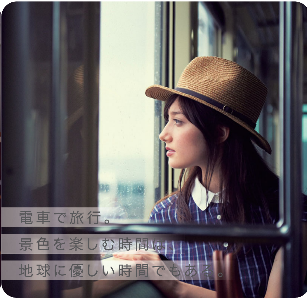
電車で旅行。景色を楽しむ時間は、地球に優しい時間でもある。