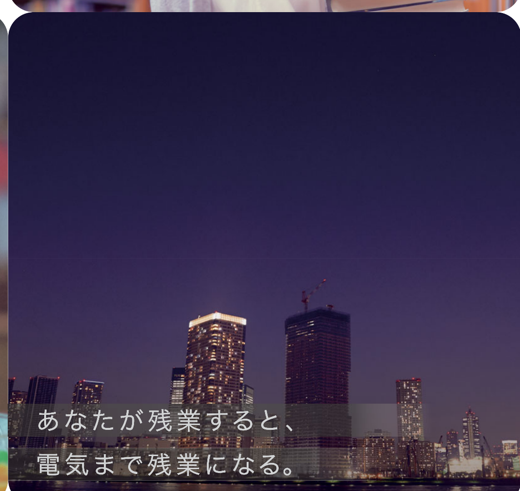
あなたが残業すると、電気まで残業になる。