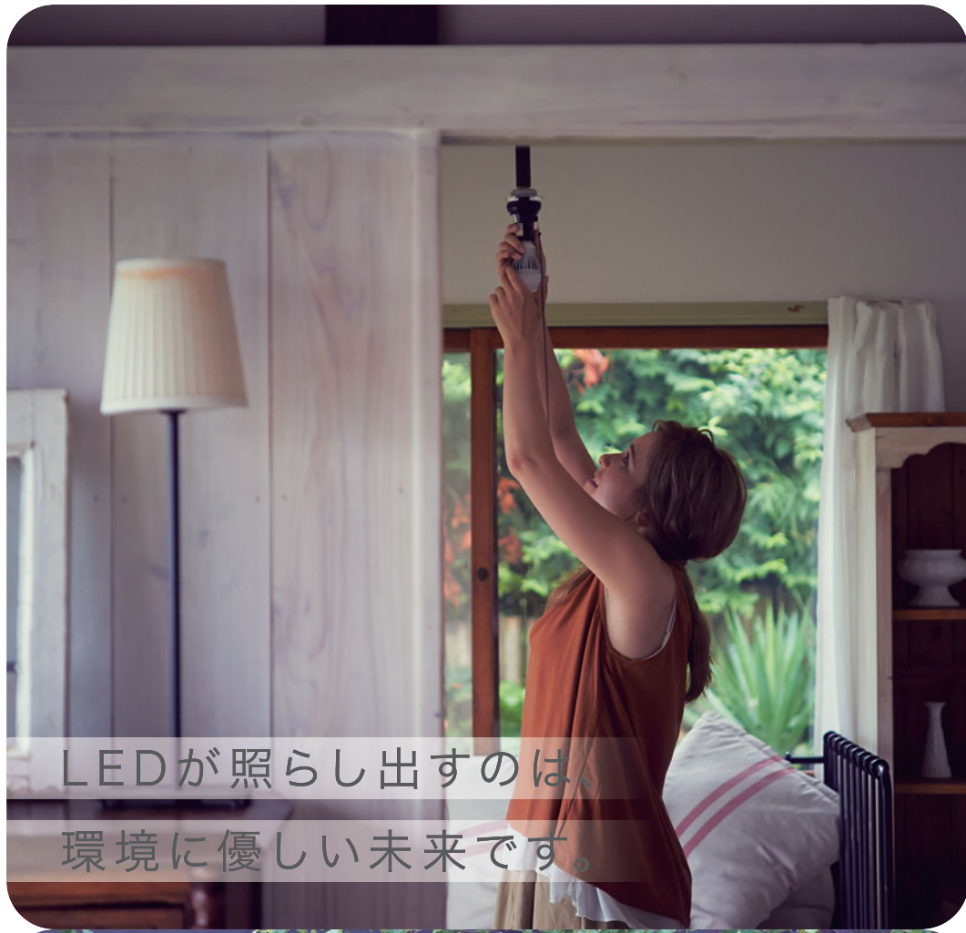
LEDが照らし出すのは、環境に優しい未来です。