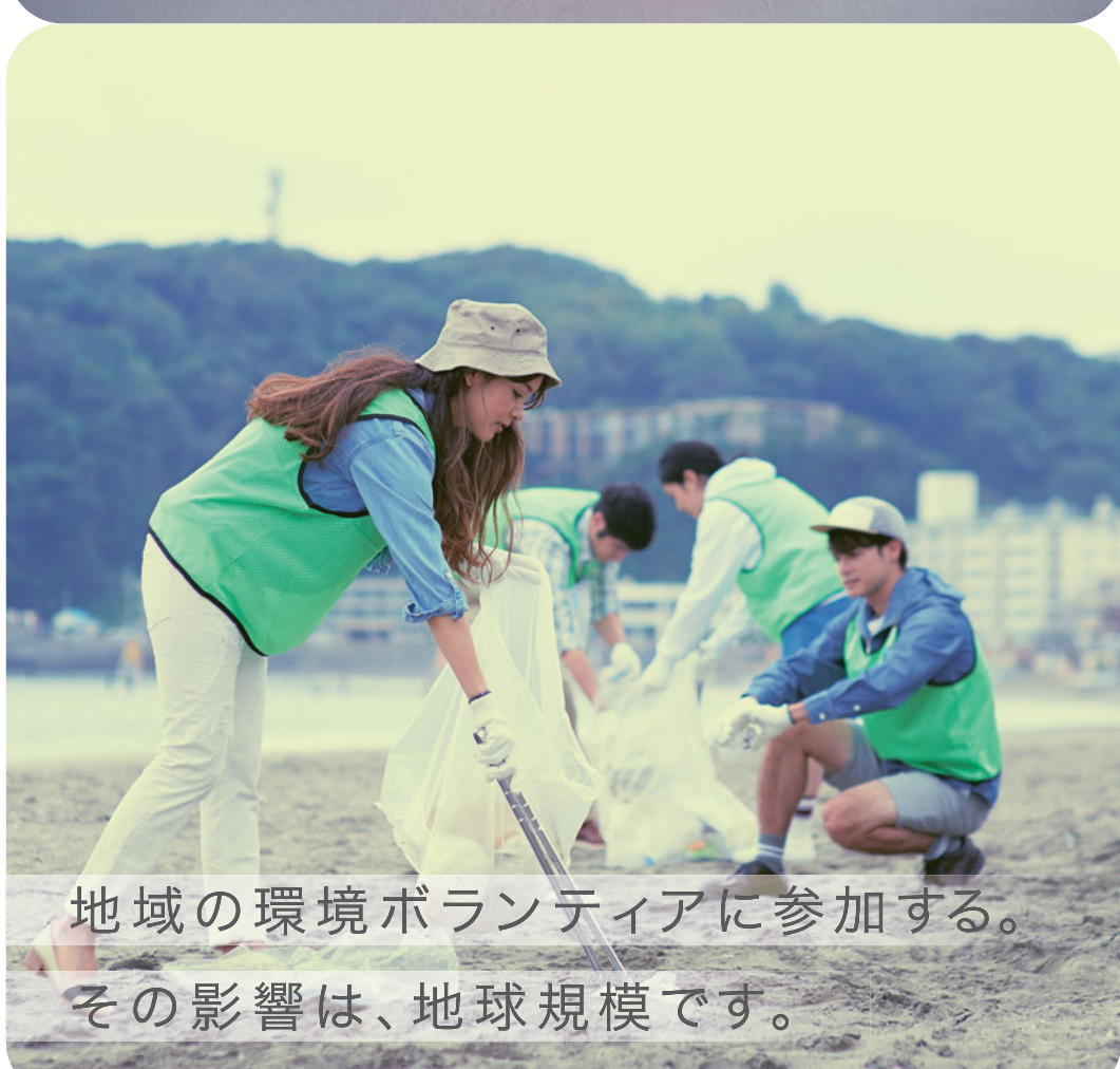
地域の環境ボランティアに参加する。その影響は、地球規模です。