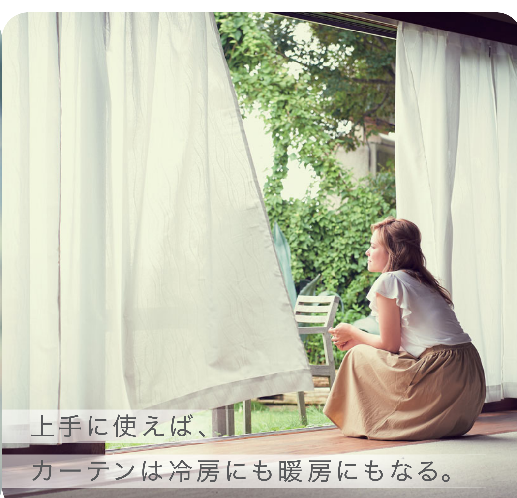
上手に使えば、カーテンは冷房にも暖房にもなる。