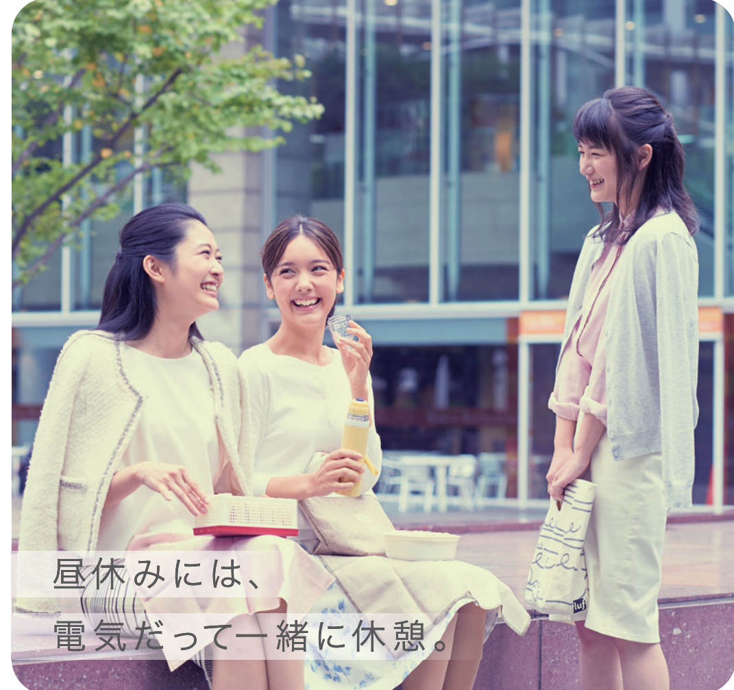
昼休みには、電気だって一緒に休憩。