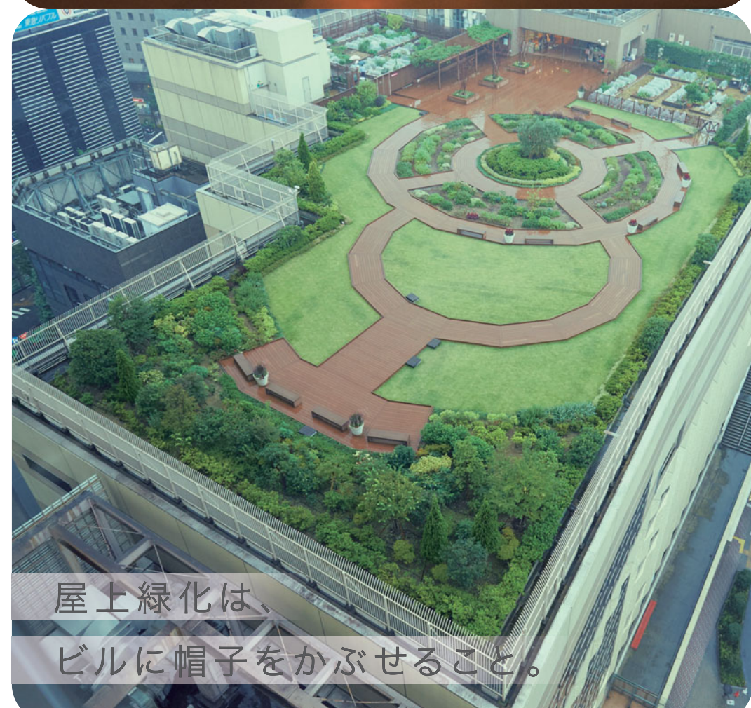
屋上緑化は、ビルに帽子をかぶせること。