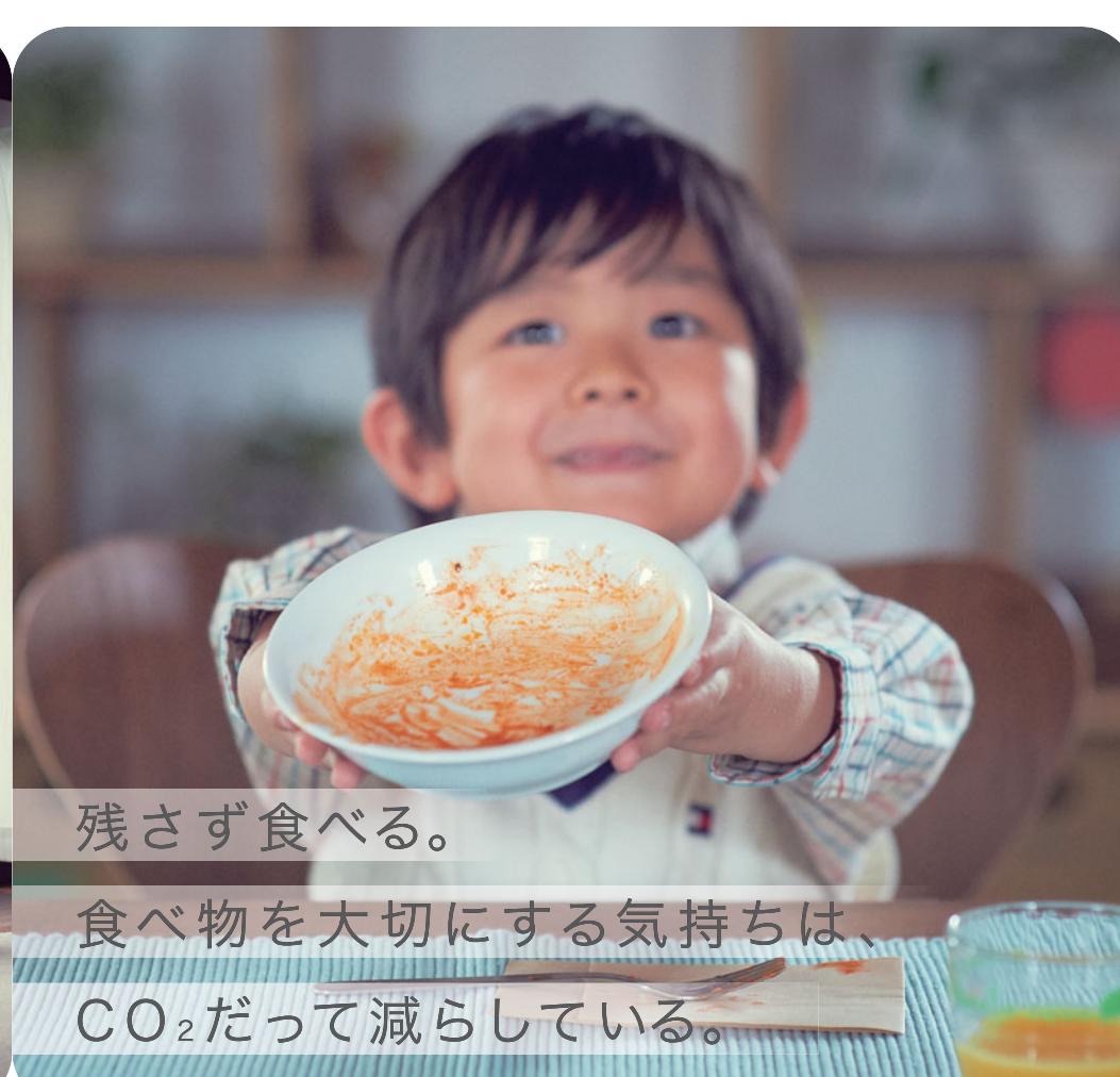
残さず食べる。食べ物を大切にする気持ちは、CO 2 だって減らしている。