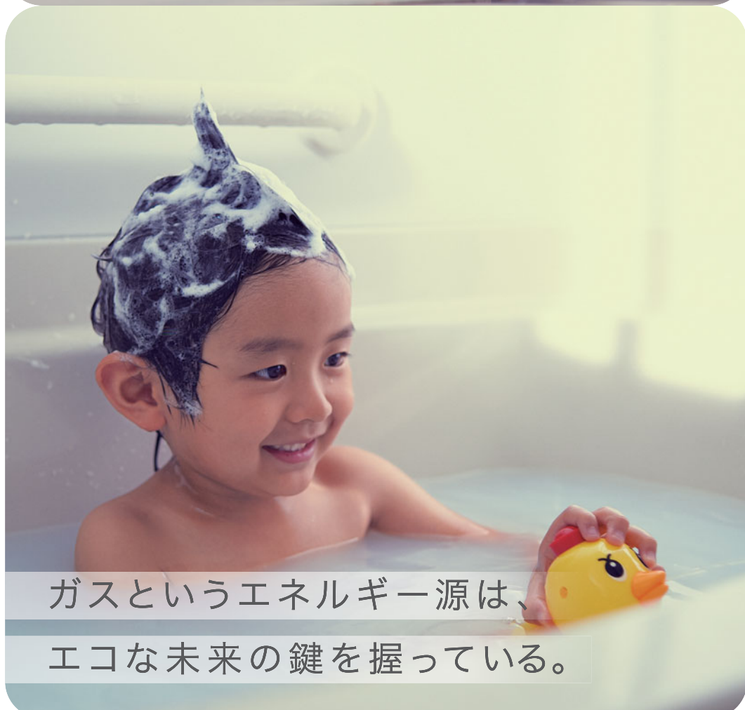
ガスというエネルギー源は、エコな未来の鍵を握っている。