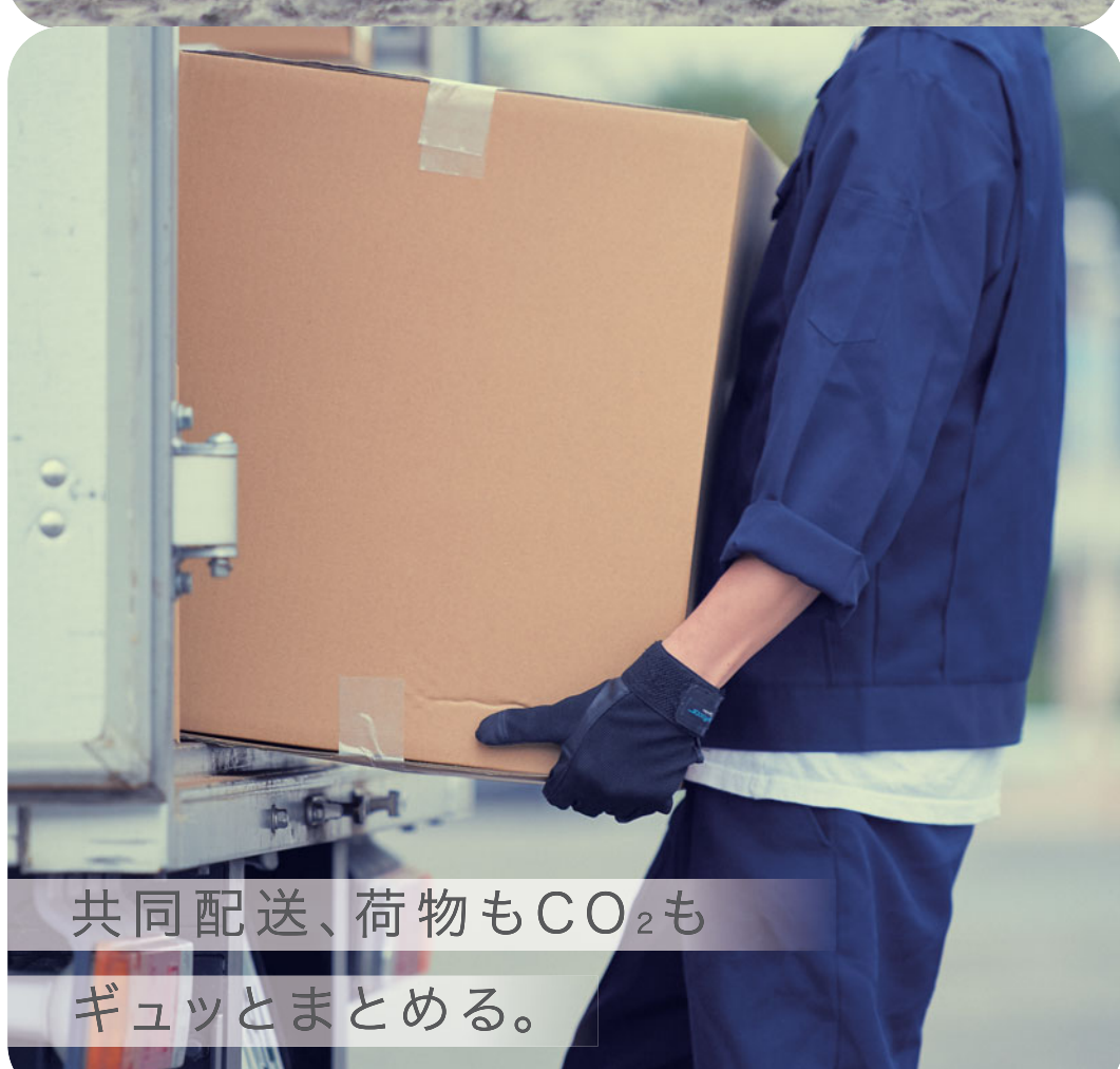
共同配送、荷物もCO 2 もギュッとまとめる。