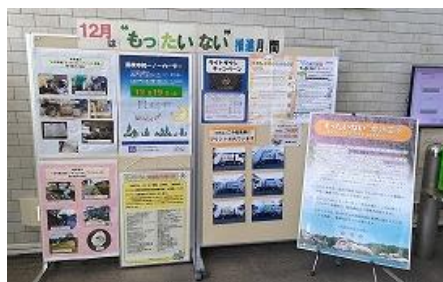
市役所ロビー展示

また、毎年12月第3金曜日を“もったいない”アクションデーとして、“もったいない”都市宣言に沿った取組みを全市的に実践しています。(アクションデーは、12月19日)