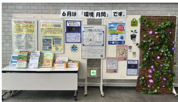
6月ロビー展示の様子

ドギーバッグをより身近に感じてもらうため、キャラクターを使ったステッカーを作成し、ドギーバッグ配布時に貼り付けて渡しました。