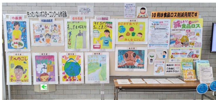
10月ロビー展示の様子