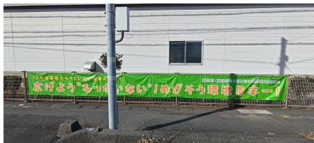
啓発のための横断幕(県道381号線沿)