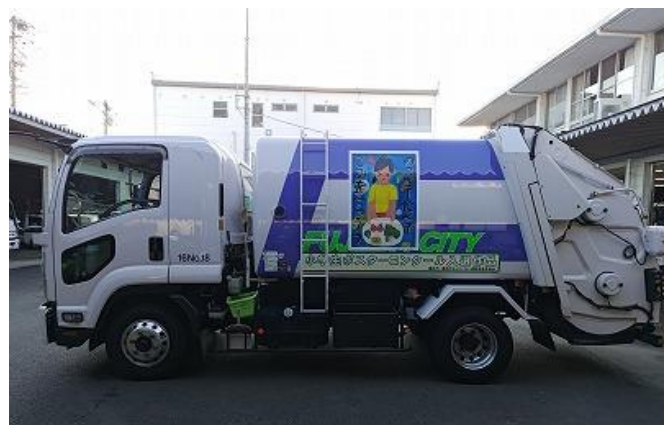
ごみ収集車にポスターの拡大シールで環境啓発