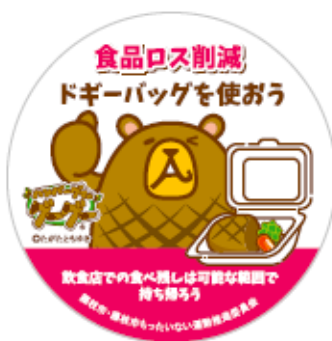
ドギーバッグステッカー