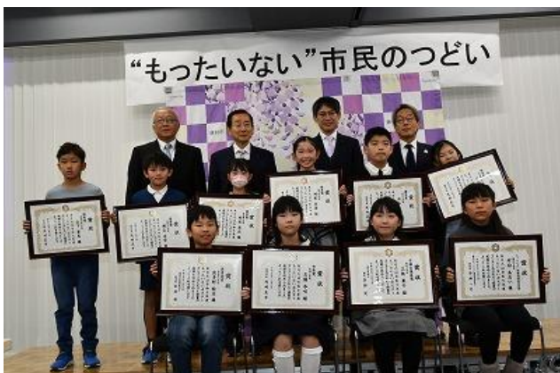
表彰式(令和7年12月6日)