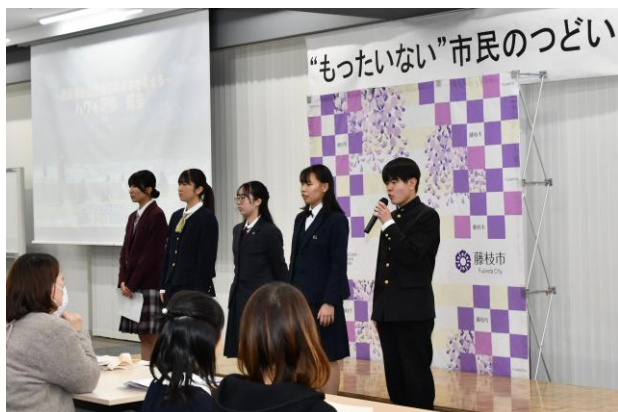
次世代環境リーダー育成事業ハワイ研修報告会

市内小学4年生を対象に環境をテーマとした「もったいない」ポスターコンクール」入賞者の表彰式や、市内の高校に通学する高校生による環境に関するハワイ研修の報告会、藤枝北高校のバイオマス資源プロジェクトの研究報告発表会、新しい清掃工場の施設の紹介を行いました。