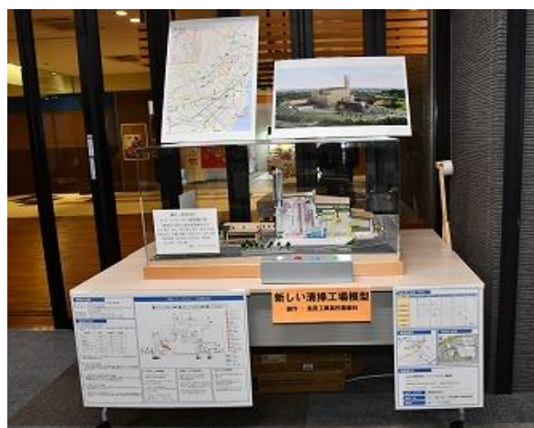
市民のつどい会場 展示の様子