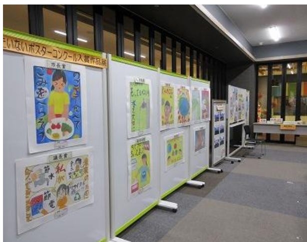
市民のつどい会場 展示の様子