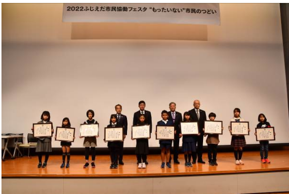
表彰式 (令和4年12月3日)