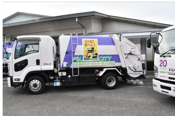
ポスターの拡大シールで環境啓発