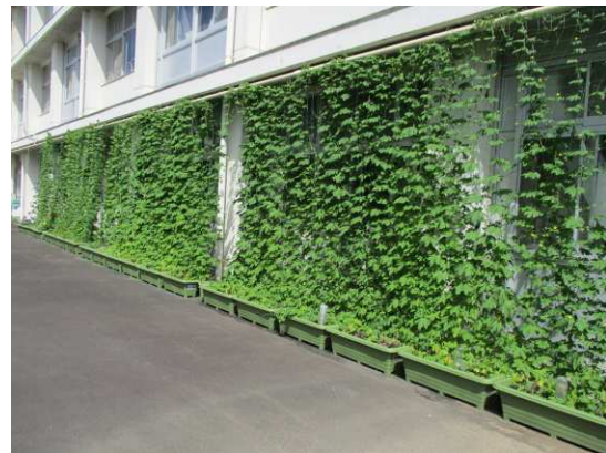
団体部門 最優秀賞作品