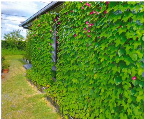
家庭部門 最優秀賞作品