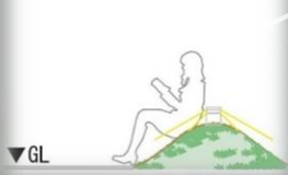
緑のマウンドタイプ