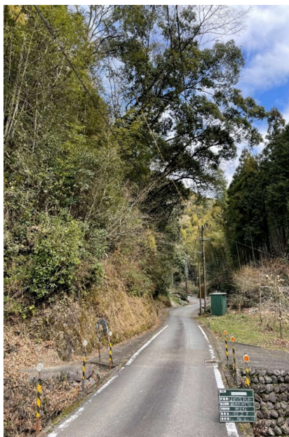
(支障木伐採実施前)