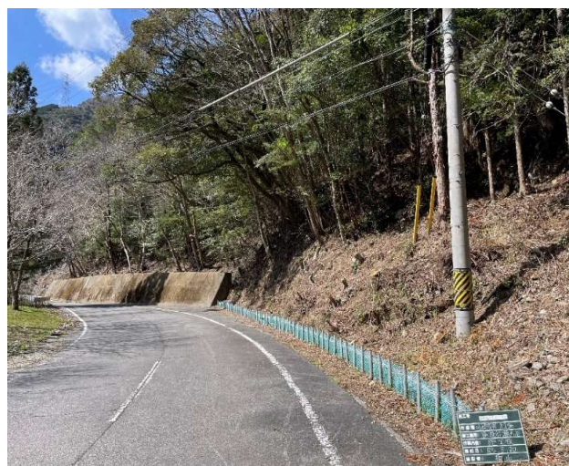
(支障木伐採実施後)