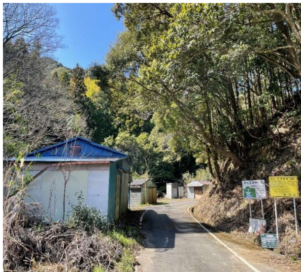
(支障木伐採実施後)