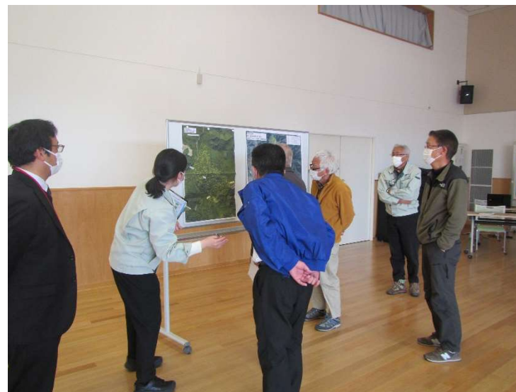
森林所有者説明会