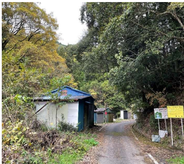
(支障木伐採実施前)