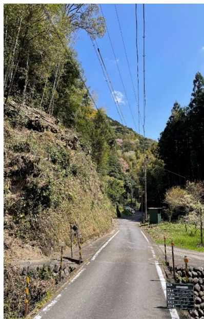
(支障木伐採実施後)